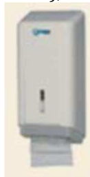
Figura 1 - Dispenser para papel higiênico