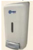
Figura 4 - Saboneteira com reservatório