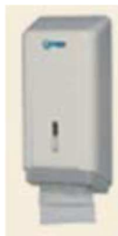
Figura 5 - Dispenser para papel higiênico