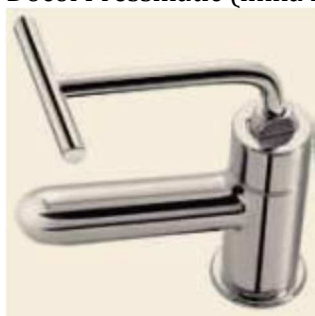
Figura 6 - Torneira PNE

Nos casos em que não é possível o uso dos produtos padronizados, os mesmos podem ser substituídos por similares, desde que mantenham características e qualidades iguais ou superiores.