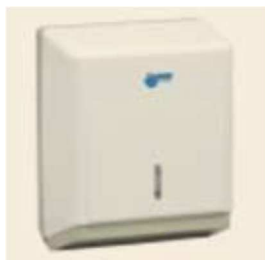
Figura 3 - Dispenser Toalheiro