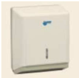
Figura 5 - Dispenser Toalheiro