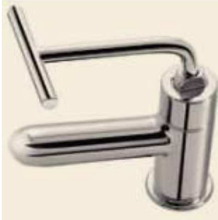
Figura 8 - Torneira PNE

Nos casos em que não é possível o uso dos produtos padronizados, os mesmos podem ser substituídos por similares, desde que mantenham características e qualidades iguais ou superiores.