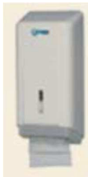
Figura 7 - Dispenser para papel higiênico