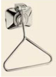
Figura 4 - Válvula de descarga PNE