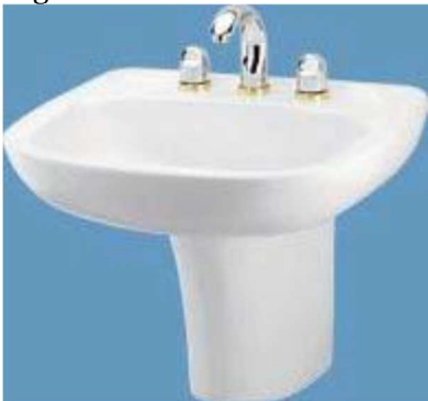
Figura 2 - Lavatório padrão