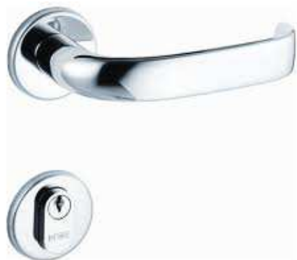
Figura 1 - fechadura padrão

Maçaneta tipo alavanca, padrão La Fonte, linha Arquiteto (cód. 6236 – CR), ou Pado, ou Papaiz com roseta, atendendo à distância mínima de 45 mm entre fechadura e face da porta/batente. Acabamento cromado.