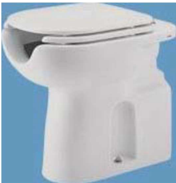
Figura 3 - Bacia sanitária PNE sem caixa acoplada