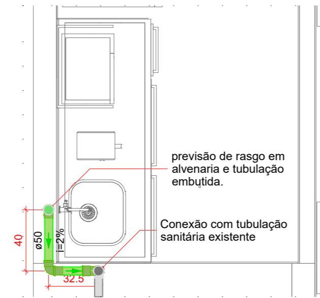
Detalhe SAN-1 Escala 1:25

A alteração do ponto sanitário deverá ser realizada por meio de rasgo em alvenaria e conexão com ponto existente sem que ocorra rompimento ou passagem de tubulação pelo piso